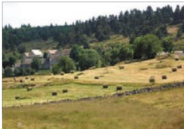
Prairie de fauche et muret à proximité des fermes

- le manque de sites de reproductions favorables est un facteur limitant. Il existe des « tas de pierres » et des murets comme sur le Causse Méjean mais la similitude s'arrête là. Sur le Causse, le calcaire gélif a été aggloméré en clapas dans les parcelles ou en rares murets périphériques au fil des générations. Il est potentiellement imperméable (au moins pour partie) au vent et à la pluie car il se délite au fil du temps et les interstices se colmatent. Sur l'Aubrac, les blocs accumulés dans les murets périphériques sont de forme arrondie et laissent passer vent et précipitations. Les blocs regroupés au milieu des parcelles depuis une dizaine d'années sont également de forme arrondie, mais de taille et de masse respectables (de 0,5 à plus de 5 m de diamètre et de 100 kg à plusieurs dizaines de tonnes). Ces tas ne génèrent pas de cavités favorables à la Chevêche.