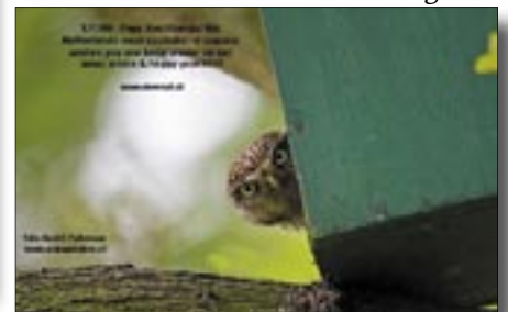
Vœux de Steenuil. http://www.steenuil.nl