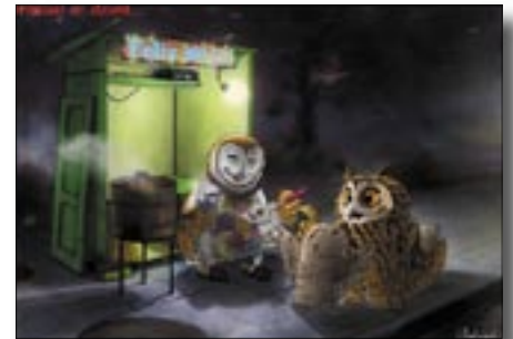
Vœux de Brintzal. www.brintzal.org