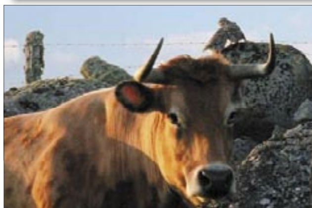
Vache de race Aubrac et chevêches.