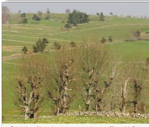
Frênes émondés, pâtûres et murets au printemps.