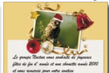
Vœux de Noctua. www.noctua.org