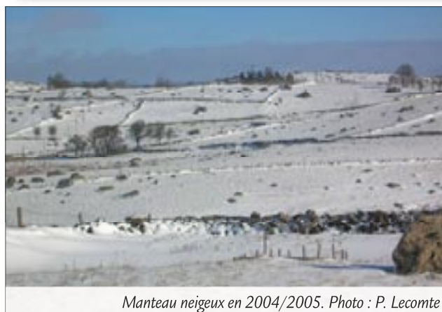
Manteau neigeux en 2004/2005.