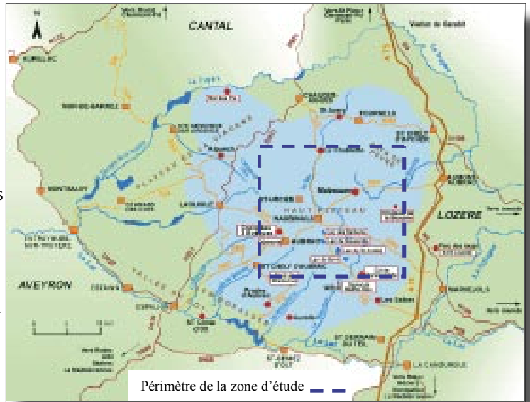
Localisation du site d'étude sur l'Aubrac

Il est délimité au nord par la vallée de la Truyère qu'enjambe le viaduc de Garabit, à l'Est par la Colagne et au sud par la vallée du Lot. Les activités économiques dominantes sont l'élevage et le tourisme. Les troupeaux de vaches (dont la race locale « Aubrac ») passent la belle saison sur le plateau, de mai à octobre, avant de retourner le plus souvent